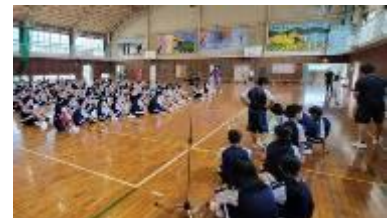
【実行委員のリードで集合する様子】