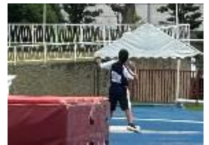
【砲丸投(5位入賞)の様子】

8月5日(土)に北野中学校で市新人水泳大会が、9月13日(水)に県立陸上競技場において市新人陸上競技大会が行われました。どの選手も精一杯自分の力を発揮できていました。地区大会出場をつかんだ2名の選手とその結果を下記に紹介します。