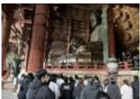
【案内の方の説明を聞いて】

全部初めて見るものだったのですごく楽しかったです。最初にぐぐった門が全部木でできていて、柱が見たことのない太さで驚きました。大仏の大きさは髪の毛まで大きすぎて、圧がすごかったです。四天王の中で、なんで2体だけ頭だけなんだろうと思いましたが、予算不足と聞いて面白かったです。シカはとてもかわいかったです。(2-2生徒)