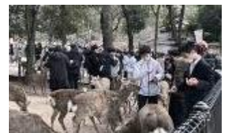
【シカとのふれあい】

全部初めて見るものだったのですごく楽しかったです。最初にぐぐった門が全部木でできていて、柱が見たことのない太さで驚きました。大仏の大きさは髪の毛まで大きすぎて、圧がすごかったです。四天王の中で、なんで2体だけ頭だけなんだろうと思いましたが、予算不足と聞いて面白かったです。シカはとてもかわいかったです。(2-2生徒)