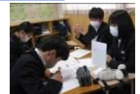
【学級で交流する様子】

みんながちゃんと学んで、楽しんでいたのよかったです。一人一人がスローガンを意識して、できていなかったことを自分で気づき反省し、これからどのように結びつけて、生活していくかまで考えていたので、すごいなと思いました。修学旅行に行って学んだことや楽しかったことをたくさん交流できたので、とてもうれしかったです。自分の反省や係の反省をこれからの生活にたくさん結び付けて、一つ一つのことを一生懸命頑張っていきたいです。スローガンの「共に成長」をこれからも大切にしていきたいです。(修学旅行実行委員)