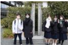
【全国水平社創立の碑】

金閣寺を見たときはとても金色で、修復されたといっても、教科書に載っている人物が建てた建物が目の前にあると思うと感動しました。平安神宮では建物がとても大きく昔の人はどのようにして作ったのだろうかと思いました。最後はバスがいっぱいで、清水寺から京都駅まで走っていったので、とても疲れたけどとても楽しい一日でした。(2-3生徒)