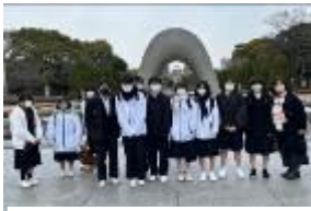
【碑めぐりでの一コマ】

広島で、戦争のこわさと平和の尊さを改めて実感することができました。原爆によって被爆した原爆ドームや服、熱によって溶けたお弁当などを近くで見ると、原爆がどれだけこわくてひどいものか知ることができました。証言者の方が言っていた、「平和や友達や家族がいることは当たり前ではない」「生命を大切にすることが平和の出発点」。この一日を終え、本当にそうだったと思った。(2-1生徒)