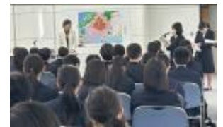
【証言者の方のお話】

広島で、戦争のこわさと平和の尊さを改めて実感することができました。原爆によって被爆した原爆ドームや服、熱によって溶けたお弁当などを近くで見ると、原爆がどれだけこわくてひどいものか知ることができました。証言者の方が言っていた、「平和や友達や家族がいることは当たり前ではない」「生命を大切にすることが平和の出発点」。この一日を終え、本当にそうだったと思った。(2-1生徒)