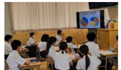
【スロメディアの取組を学ぶ様子】

6月15日(木)、16日(金)の2日間、1学期期末テストを行いました。1年生にとっては初めての定期テスト。6月1日(木)に全校でテストに向けての学習計画を立て、また、スロメディアの取組についても確認しました。その頑張りの成果はいかがだったでしょうか?