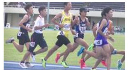
【地区陸上大会での力走】

市陸上大会午前中は強い雨風の厳しいコンディションでしたが、午後は雨も上がり、本校の代表選手の皆さんは、それぞれの種目において練習の成果を十分に発揮してくれました。市大会で6位までの入賞者は、6月12日(月)の「筑後地区陸上競技大会」に出場しました。