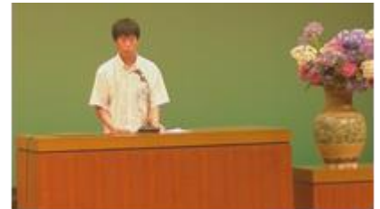
【聴衆の心をひきつけた弁論】

本校代表生徒(3年生)が演題『誰にとつての「普通」?』の弁論を披露してくれました。声の抑揚や手振り等の工夫も交えながら、堂々と落ち着いた態度で自分の考えを主張し、聴衆の皆さんの心を強くひきつける素晴らしい弁論でした。応援の生徒の皆さんもありがとうございました。この素晴らしい弁論を全校生徒の皆さんに披露してもらつう機会が文化祭で予定されています。是非の楽しみにしててください。